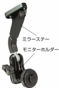
ミラーステー モニターホルダー