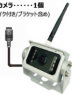
カメラ側ケーブル 長さ3m