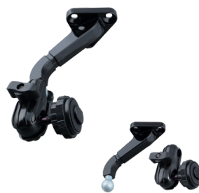
吊り下げ式モニターブラケット各種