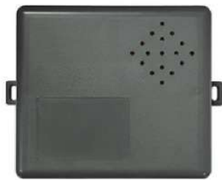
本体(コントロール)