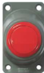
下車確認 スイッチ