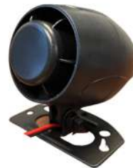
外部スピーカー (サイレン)