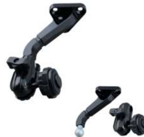
吊り下げ式モニターブラケット (※車種により適合が異なります。)