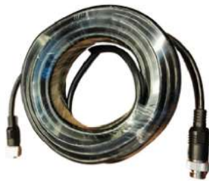
延長ケーブル (長さ各種)